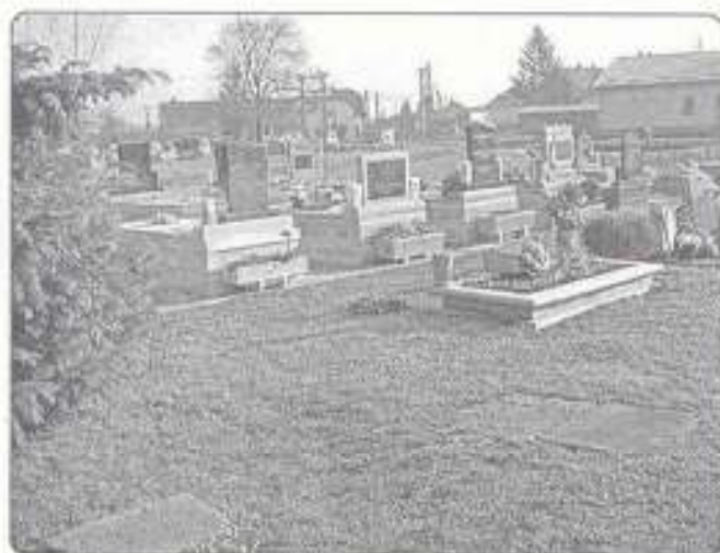
kegyeleti hely a temetőben