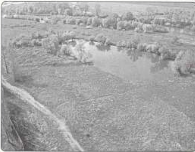
Sajóparti szeméttelp felszámolása