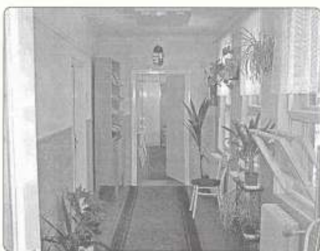
Benedek Elek Ált. Isk. belső felújítás