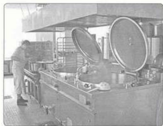
az új konyha