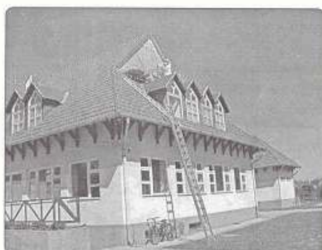
Közösségi Ház felújítási munkák