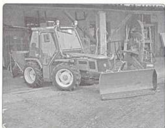
pályázaton nyert traktor