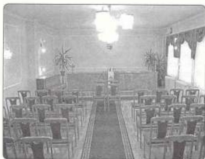
a felújított házasságkötő terem