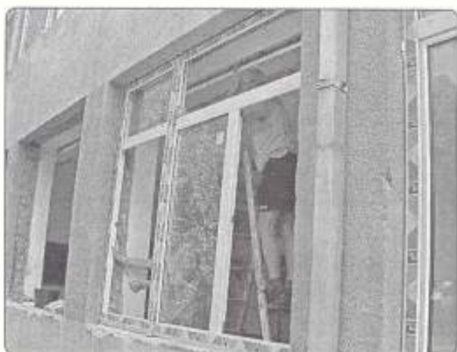
H. O. Ált. Isk. nyílászárók cseréje