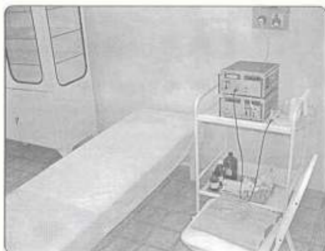
az új fizikoterápia