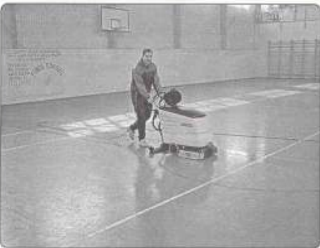
takarítógép a Sportcsarokban