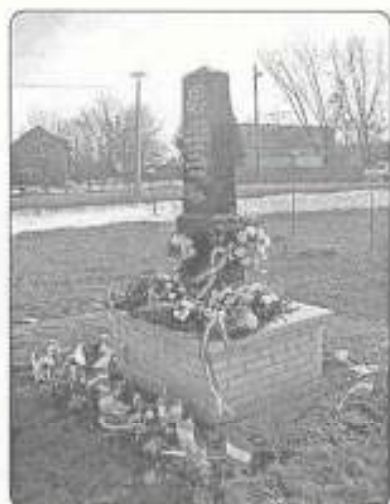
a zsolcai csata emlékműve