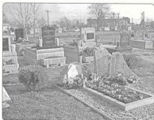
a II.Vh-ban kényszermunkára elhurcoltak emlékműve