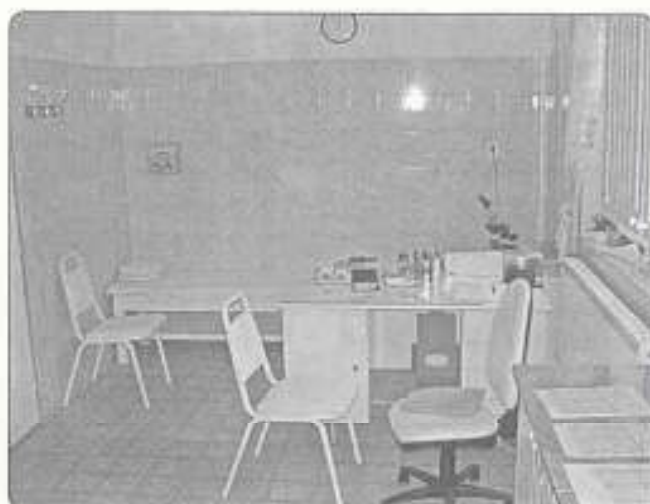
az új laboratórium