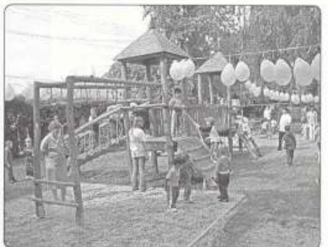
új játékok a 2. sz. Óvodában