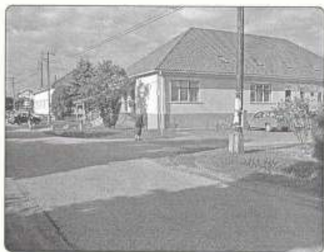
a magújult orvosi rendelők