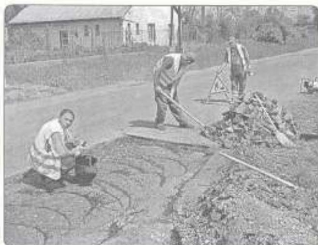
kátyuzás saját eszközökkel