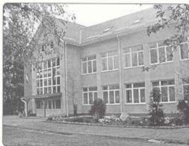
a felújított Herman Ottó Ált. Iskola