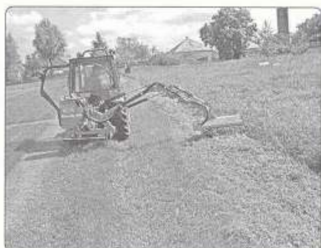
munkában az új fúkasza